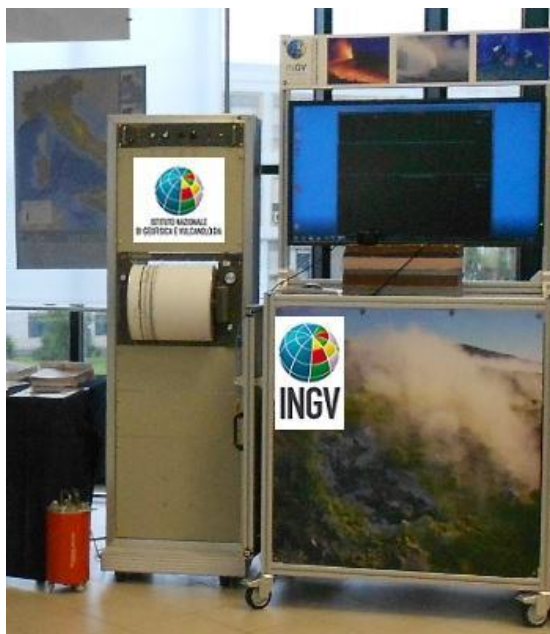
Figura 4. Sismografo

Inoltre, gli studenti potranno assistere allo spettacolo “ Magie di Chimica ”, reazioni chimiche divertenti e spettacolari tanto da sembrare delle “ Magie ” (Figura 5).