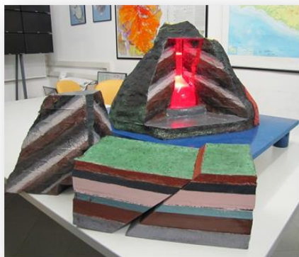
Figura 1. Modello di vulcano