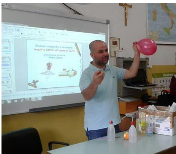
Figura 5. Magie di Chimica

Inoltre, gli studenti potranno assistere allo spettacolo “ Magie di Chimica ”, reazioni chimiche divertenti e spettacolari tanto da sembrare delle “ Magie ” (Figura 5).