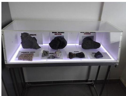
Figura 3. Rocce Vulcaniche